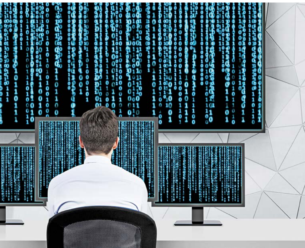
Datenmengen: In der Zeitarbeit gibt es bei deren Verarbeitung einige Besonderheiten.

Die DSGVO übernimmt einen Grundsatz des deutschen Datenschutzrechts auch auf europäischer Ebene: Die Verarbeitung personenbezogener Daten bedarf stets einer Rechtsgrundlage. Dieses